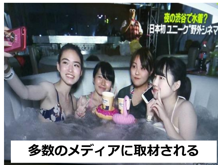
多数のメディアに取材される