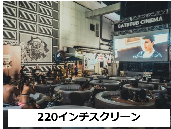
220インチスクリーン